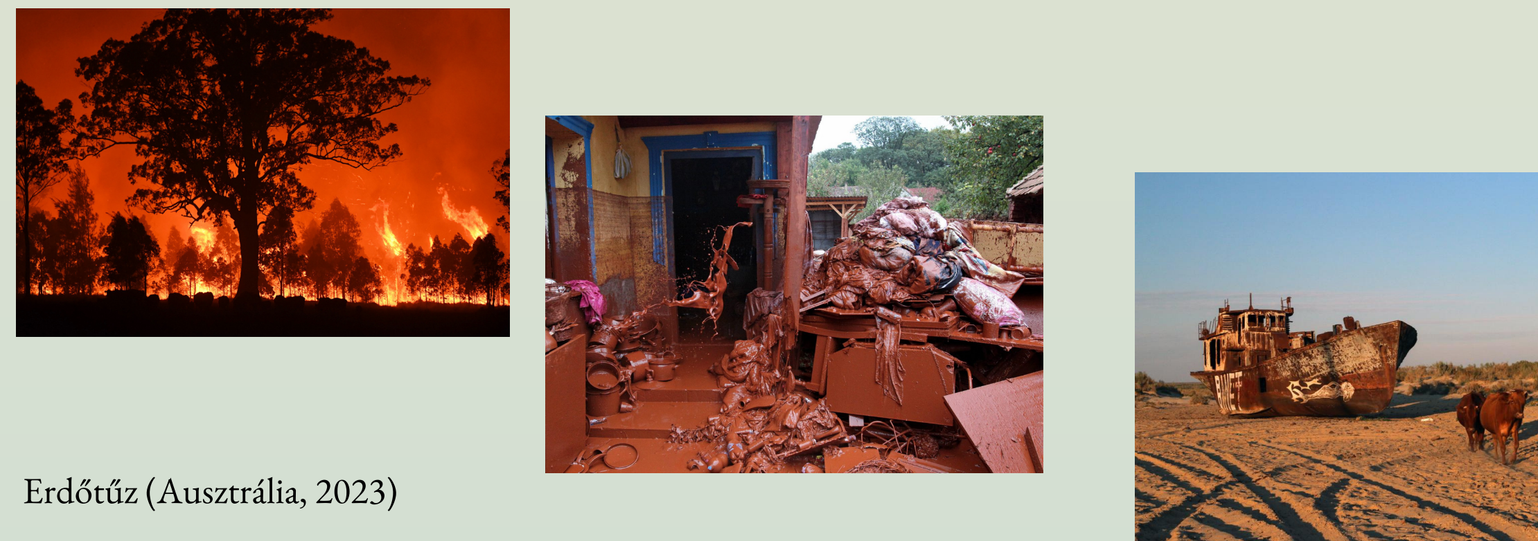
Erdőtűz (Ausztrália, 2023) Vörösizap- katasztrófa (Magyarország, 2010) Aral - tó kiszáradása (2014-)

Vannak esetek, amikor a természet erői sem tudnak figyelemmel fordulni a civilizáció sikerei felé. Nem kímélik a műalkotásokat, építményeket vagy materiális értékeket melyek nagyobb erényt képviselnek a társadalom szemében, mint a munkálatlan környezet.